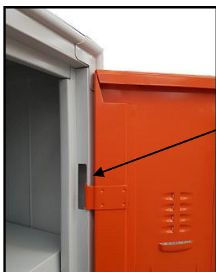
Cardine e perno di rotazione Interno