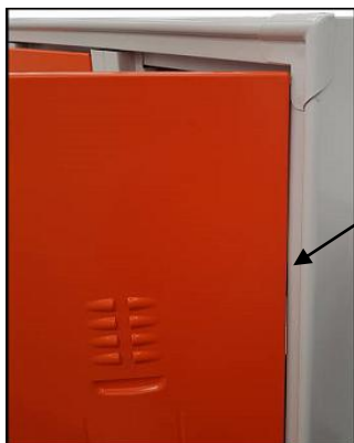
Cerniere interne anti scasso non visibili dall'esterno